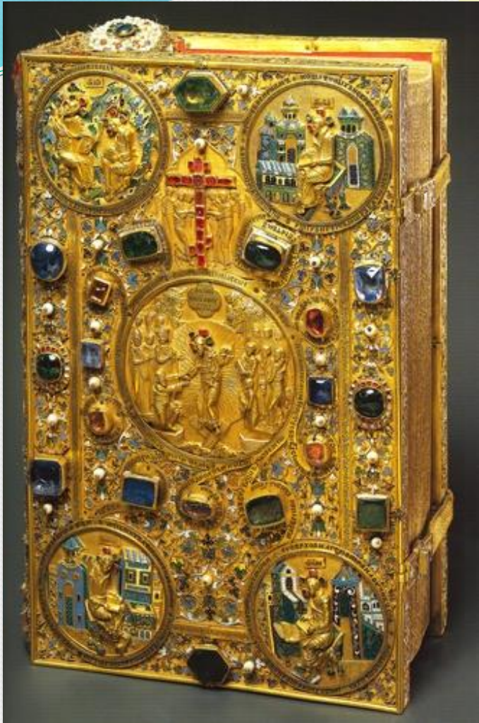
Евангелие. Москва. Первая половина XVII в. Мастер Г. Овдокимов. 1632 г.

В роли распространения просвещения выступали как государство, так и церковь. В 40-е гг. приглашённые из Киева учёные-монахи обучали в Андреевском монастыре славянскому и греческому языкам, философии и риторике, другим наукам.