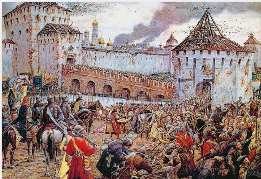
Освобождение Москвы в 1612 г. Художник Э.Э. Лисснер.

В русской культуре XVII века прослеживаются черты перехода от средневековья к Новому времени. Главная особенность культуры этого периода состояла в усилившемся процессе её обмирщения , т.е. освобождения от церковного влияния. Большую роль в этом сыграли события Смутного времени, войн и освоения бескрайних просторов Сибири. Эти события втянули в свой водоворот огромные массы людей и показали их мощь, вдохнули новые представления о «силе земли». Общество и отдельная личность начали осознавать свою важную роль в судьбах страны.