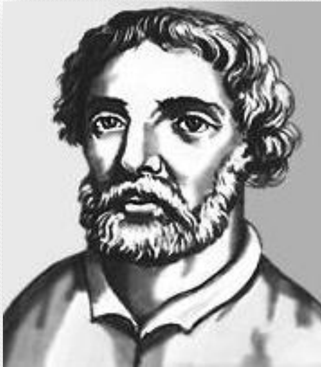
Разин Степан Тимофеевич . Донской казак, предводитель Крестьянской войны 1670 – 1671 гг.

Фольклорный материал заполняет многочисленные рукописные сборники исторического, церковно-литургического содержания, сборники песен, пословиц и поговорок, сказок и преданий, заговоров и свадебных обрядов.