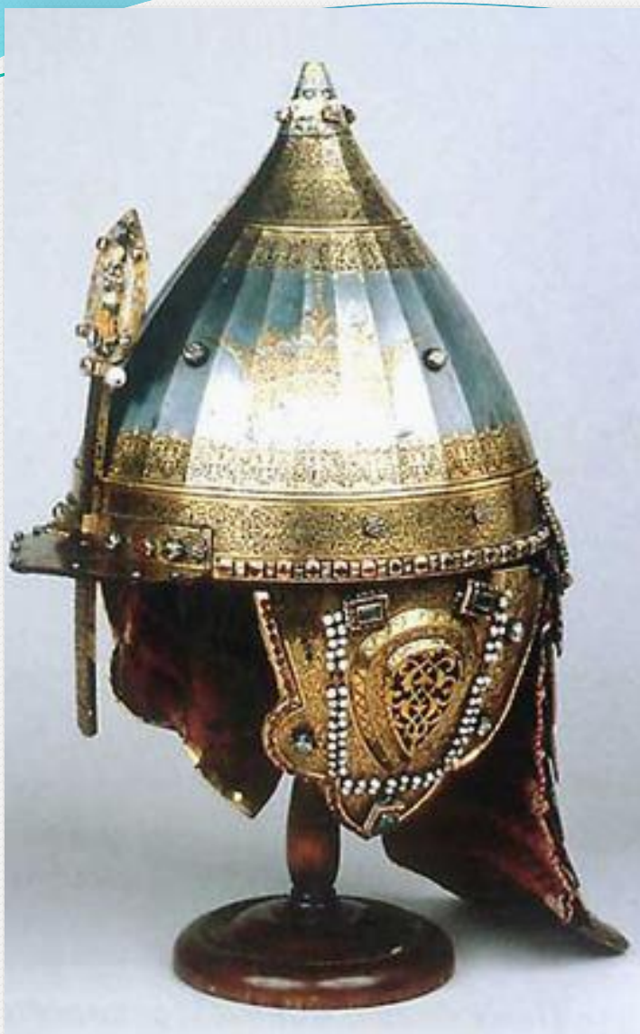
Шлем царя Михаила Фёдоровича. Москва. 1621 г.

Русские славились как мастера по изготовлению качественных нарезных ружей, пушек, больших и малых колоколов. Уже тогда мехи у домен и тяжёлые молоты, ковавшие железо, использовали энергию воды.