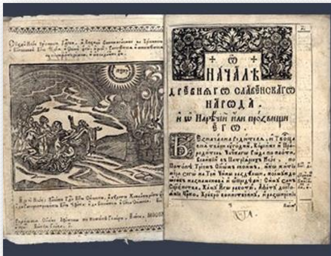
Первый русский учебник истории. Составлен для сына царя Алексея Михайловича Фёдора. 1674 г.

От иноземцев русские перенимали навыки в области архитектуры и живописи, обработки золота и серебра, металлургического и военного производства, обучались языкам – греческому, латинскому, польскому и прочим.