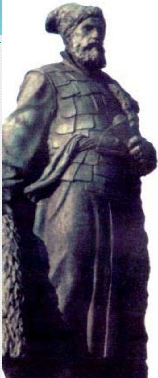
Памятник русскому землепроходцу Ерофею Хабарову в Хабаровске.

Значительный вклад в развитие географических знаний внесли русские землепроходцы. В 1648 г. экспедиция Семёна Дежнева (за 80 лет до Витуса Беринга) вышла к проливу между Азией и Северной Америкой. Самая восточная точка нашей страны носит сейчас имя Дежнева. Е.П. Хабаров в 1649 г. составил карту и изучил земли по Амуру, где были основаны русские поселения. Его имя носят город Хабаровск и посёлок Ерофей Павлович. В самом конце XVII в. Сибирский казак В.В. Атласов обследовал Камчатку и Курильские острова.