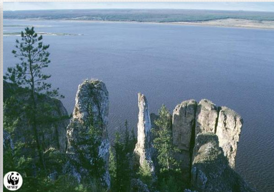
Ленские столбы. Якутия.