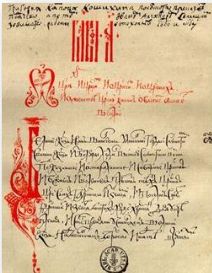
Титульная страница книги Григория Котошихина «О России в царствование Алексея Михайловича. 1665 г.

В XVII в. , как и ранее, шёл процесс накопления знаний. Большие успехи были достигнуты в области медицины, в строительном деле, в решении практических задач по математике (многие умели с большой точностью измерять площади, расстояния, сыпучие тела и т.п.), по изготовлению красок, олифы, чернил, подъёму соляного раствора с большой глубины, в наблюдении за природой и т.д.