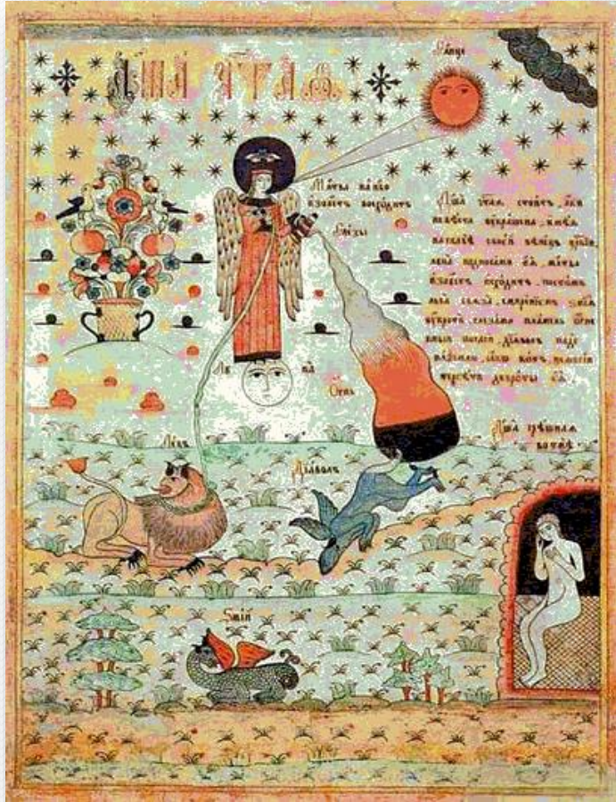
Душа чистая и душа грешная. Миниатюра из синодика. 17 век.

Расширение сферы торгово-ремесленной деятельности, рост аппарата власти складывающегося абсолютизма, усиление внешнеполитических связей России, потребности обороны страны требовали увеличения числа образованных людей.