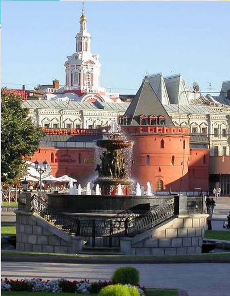
Законоспасский мужской монастырь в Китай-городе. Здесь до 1814 г. размещалась Славяно-греко-латинская академия.