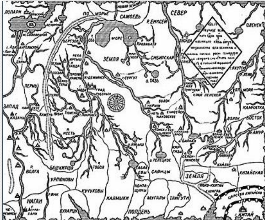
Карта Сибири, составленная Петром Годуновым. 1667 г. (Фрагмент). Орфография и пунктуация современные.

На рубеже XVI – XVII вв. появилась общая карта России. Этот «Старый Чертёж» не сохранился и в 1627 г. составили «Новый Чертёж» земель между Доном и Днепром, и «Книгу Большому Чертежу» : перечень городов России, расстояний между ними.