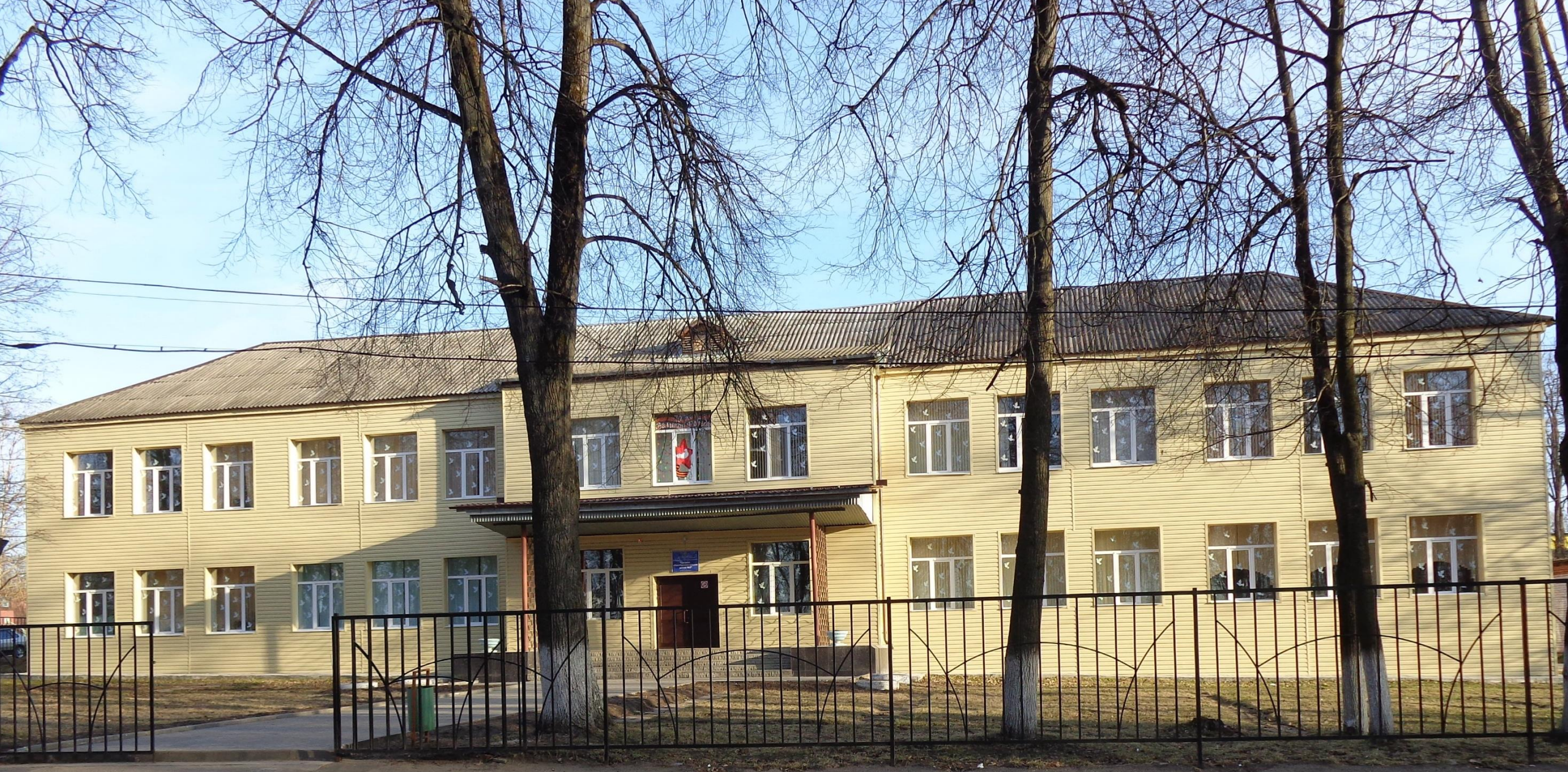
МКОУ «Средняя общеобразовательная школа № 2», г. Киров, Калужская область