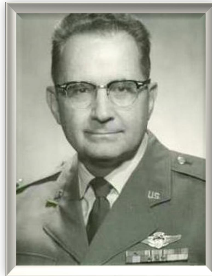
Эдвард Мерфи Американский авиаконструктор (1919 – 1990)