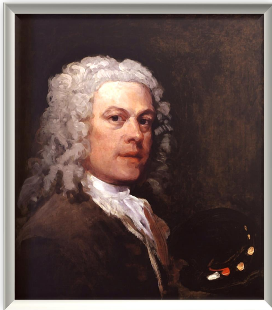
Уильям Хогарт Английский художник (1697 – 1764)