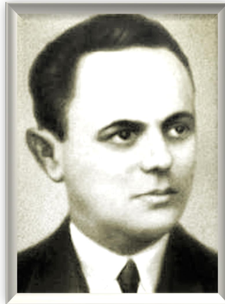
Дон-Аминадо Русский поэт-сатирик (1888 – 1957)